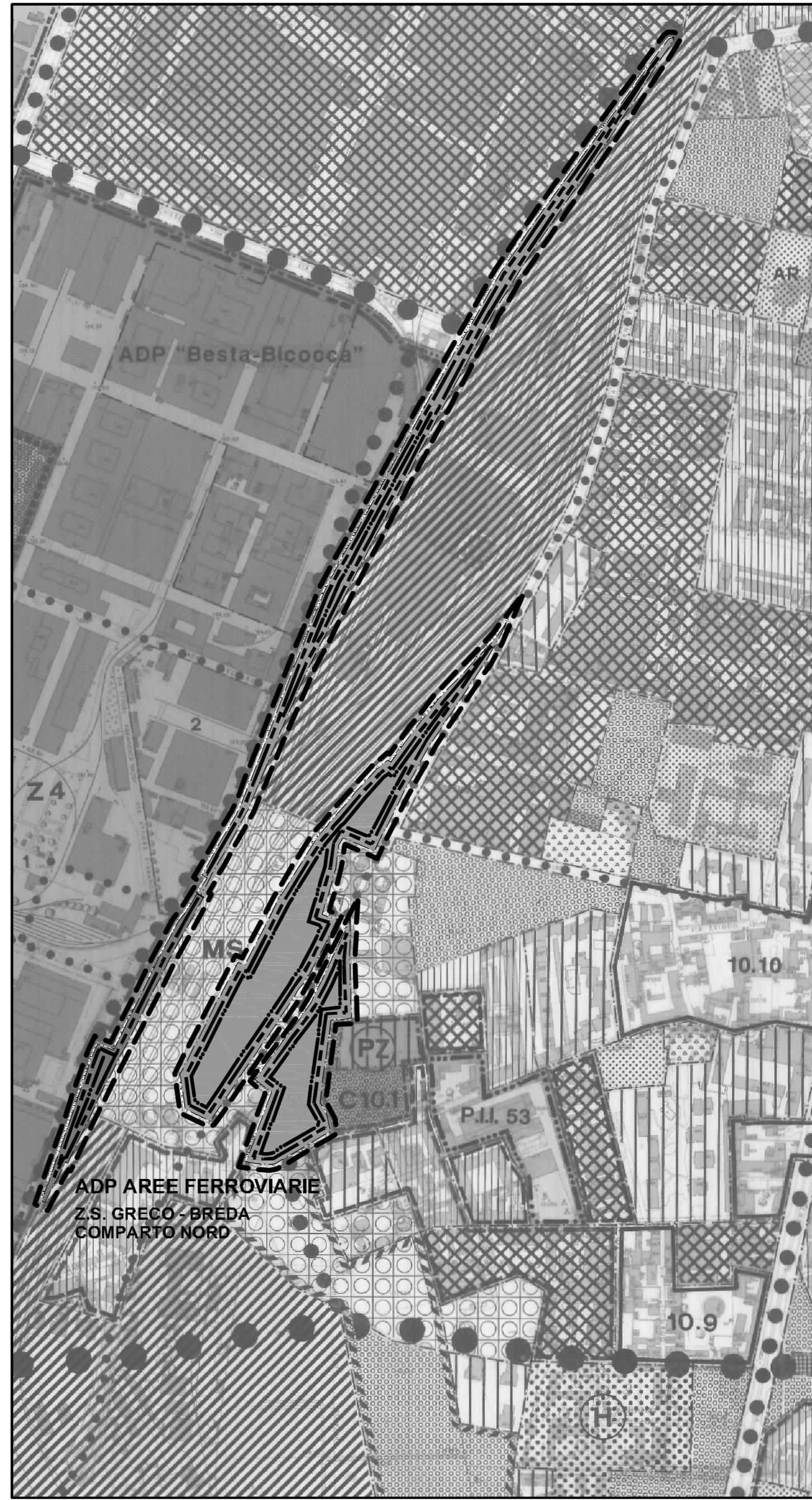
VARIANTE AL P.R.G. VIGENTE - SCALA 1:5000