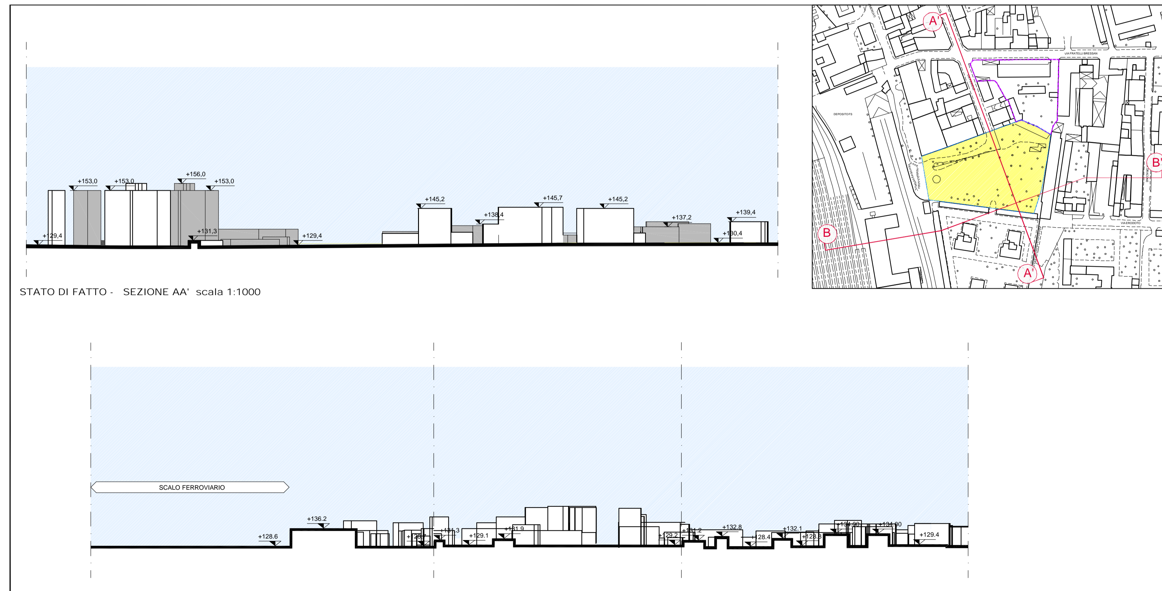
STATO DI FATTO - SEZIONE AA' scala 1:1000